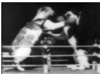
Streitlustige Kamikatzes praktizieren den Boxkampf.

Ka|mi|katz , die: 1) (Depravatus sacrificus) räuberisches Karikatier (→ karikatieren ), animalistiger Großraubkater 2) ugs. sinnlose Selbstaufopferung, Vergebleiche